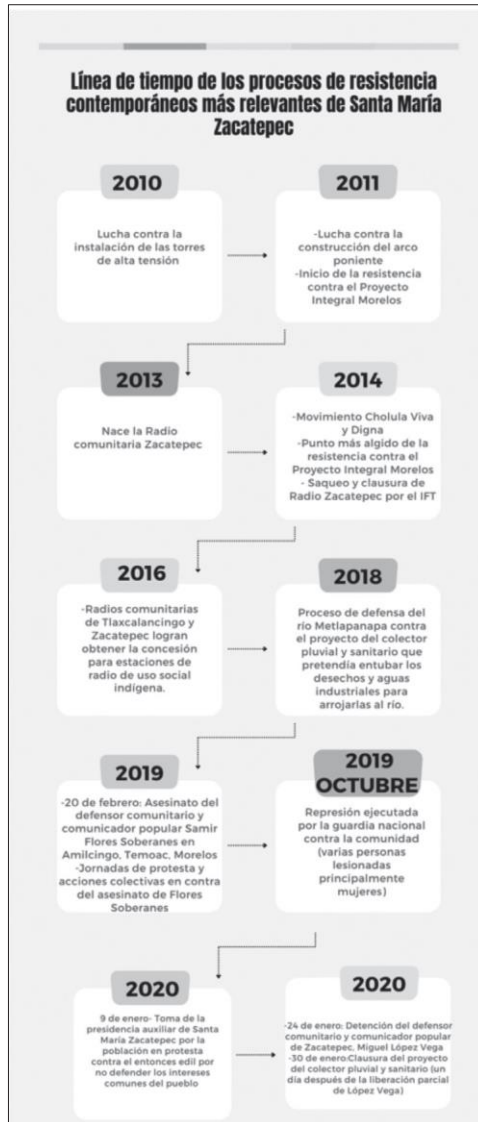
Figura 1. Línea de tiempo de los procesos de resistencia contemporáneos más relevantes de Santa María Zacatepec