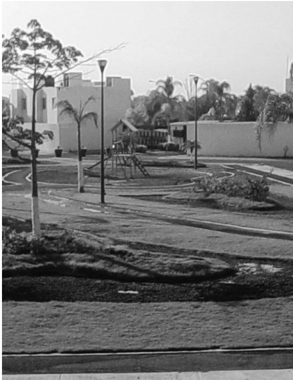
Imagen 1. Fotografías tomadas en Valle del Asenso entre junio y agosto de 2013.

propio (aunque con intermitentes problemas para dar el servicio) y sistema de recolección de basura, administrados por una Asociación de Colonos mediante un sistema de cuotas bimestrales de 250 pesos (que, como en muchos otros cotos de este tipo, no pagan muchos de los hogares). La cuota no ha subido en diez años; es decir, su valor real ha caído aproximadamente 50% (según la calculadora de inflación de INEGI). Puede ser un indicador de la insuficiente legitimidad de la Asociación de Colonos y del sistema de mercantilización de los servicios (jardinería, atención del pozo, seguridad), notas principales del régimen condominal en este tipo de fraccionamientos (véanse Jorquera, 2011; Simmel, 1986, cit. en Svampa, 2004).